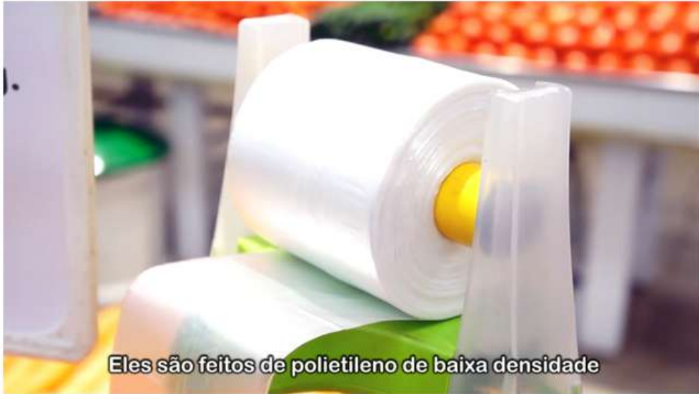
Eles são feitos de polietileno de baixa densidade