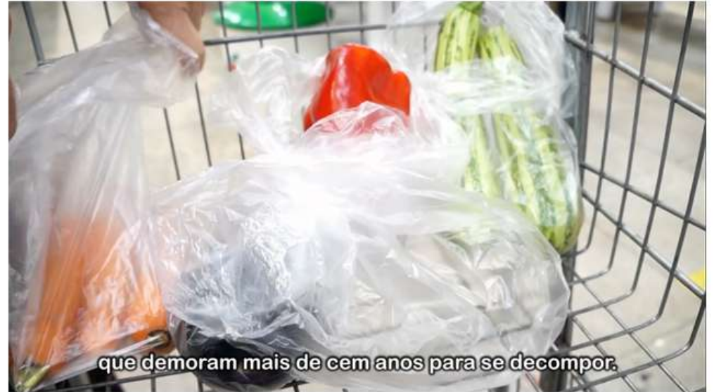
que demoram mais de cem anos para se decompor.