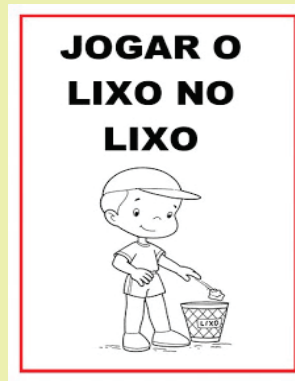
Lixo no lixo – imagem - Alessandra Souza

Vacinar animais de estimação periodicamente, eliminar insetos vetores, não consumir água de origem duvidosa, lavar bem os alimentos, realizar pelo menos o exame parasitológico de fezes duas vezes ao ano, manter unhas bem cortadas e mãos lavadas e andar sempre calçado.