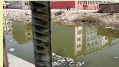
Parte do Rio Pirai Poluído