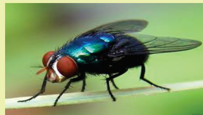
Inseto vetor de doenças parasitárias