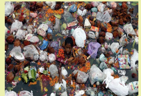
Rio poluído